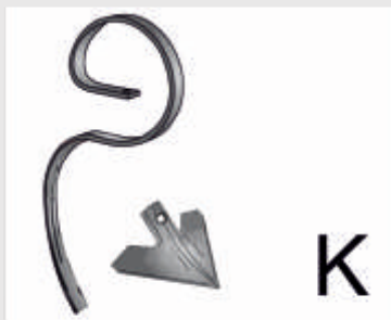
Ελατήριο S ύψος 53εκ.ατ. 200χιλ. μαχαίρι

Το βάθος εργασίας των Ελατηρίων ρυθμίζεται Υδραυλικά και καθορίζει το βάθος σποράς. Το σύνολο των ελατηρίων καλλιεργεί το έδαφος και ταυτόχρονα ξεριζώνει τα ζιζάνια σε όλο το πλάτος εργασίας.